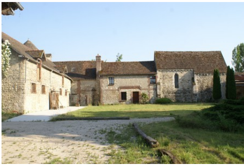
La cour du manoir