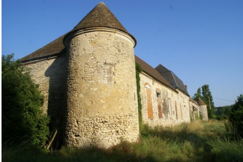
La tour d'angle nord-ouest