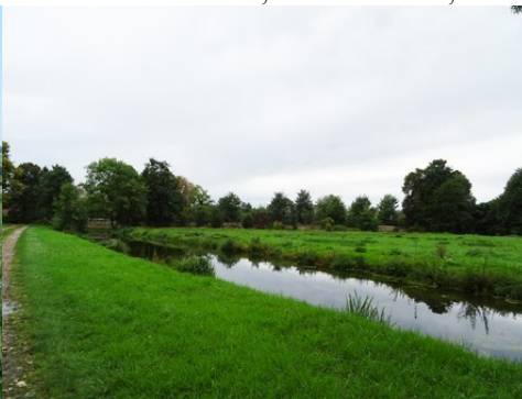
Paysages ruraux autour du manoir