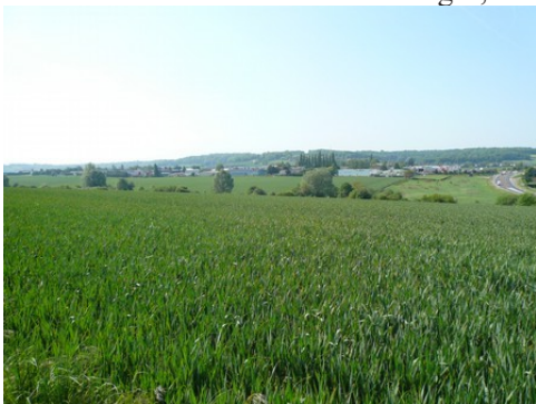
Les paysages ruraux autour de Gisors

Les avis seront cohérents avec ceux émis ces dernières années, à savoir : pas de maisons à volume compliqué (type V, W, Y, ou Z), pentes à 45° pour les volumes principaux, ardoise ou tuile plate de teinte brun vieilli, à 20u/m 2 , avec un débord de toiture de 20cm, enduit de teinte beige clair avec modénatures (au choix : chaînages, encadrement de fenêtres, soubassement, colombage...). *Voir les autres fiches.