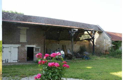
Les traces de l'exploitation agricole