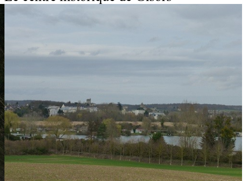
Vue sur la ville de Gisors