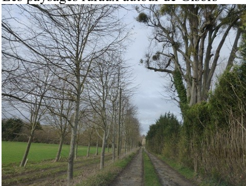
L'allée menant au manoir