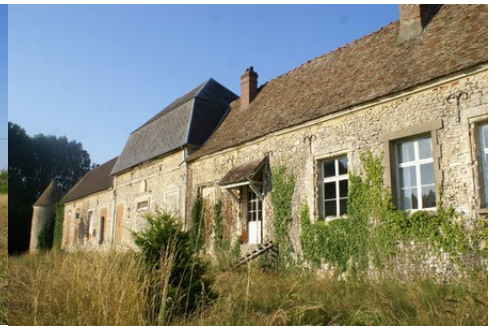
La façade ouest (vue rapprochée)