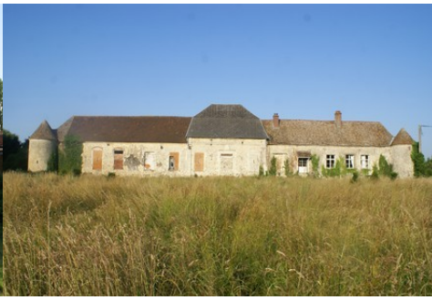
Le manoir vu de l'Ouest