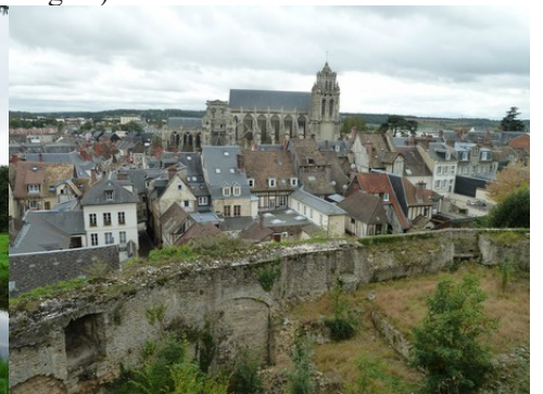
Le centre historique de Gisors